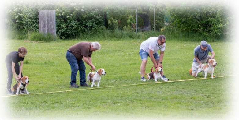
Die LG NORD beim Hunderennen.

Die nächsten NEWS folgen Anfang Juni 2024.