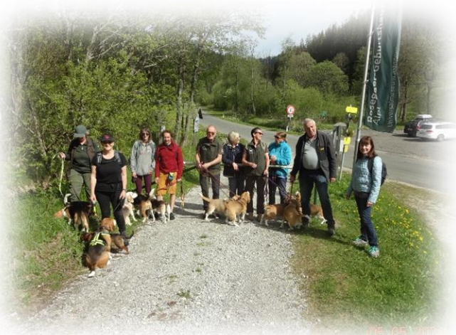
Die LG SÜD am Alpl.

Am 5.5. wurde gewandert! Drei Landesgruppen wollten an diesem Sonntag das schöne Wetter ausnützen, um gemeinsam in der Natur mit ihren Hunden unterwegs zu sein. Die LG OST veranstaltete ein Maifest mit Hunderennen in Traiskirchen, die LG SÜD marschierte über 8 km in der Waldheimat zu den Rosegger-Gedenkstätten am Alpl und die LG NORD wanderte mit 22 Personen und sehr vielen Hunden in Kremsmünster. Alle drei Veranstaltungen waren sehr gut besucht und die Beagle hatten Freude daran, miteinander unterwegs zu sein.