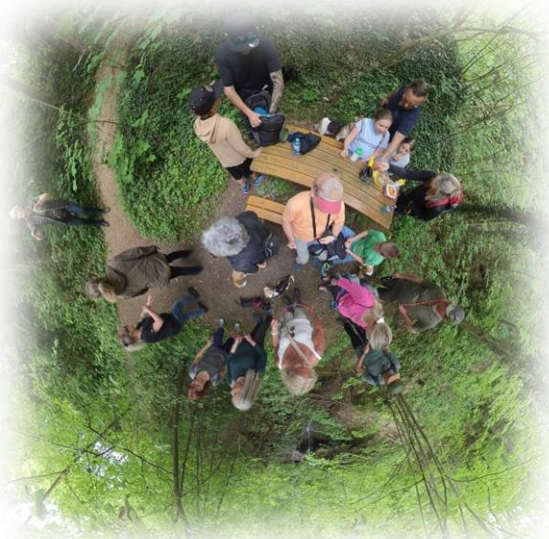
Die LG NORD aus ungewöhnlicher Sicht.