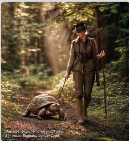
Die argentinische Landschildkröte. Ein treuer Begleiter bei der Jagd.

4 x CACA | 3 x CACIB Alle Rassen an allen Tagen!